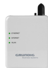
Als LAN oder WLAN Adapter