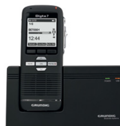
Für Digta Station

Standort Nürnberg: Läufer Weg 94 90552 Röthenbach a.d. Peg. Telefon: 0911 / 50 49 91 - 50 Fax: 0911 / 50 49 91 - 55